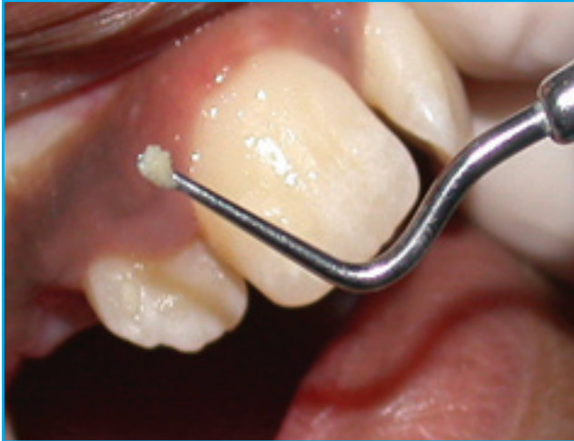
البيوفيلم بالعين المجردة