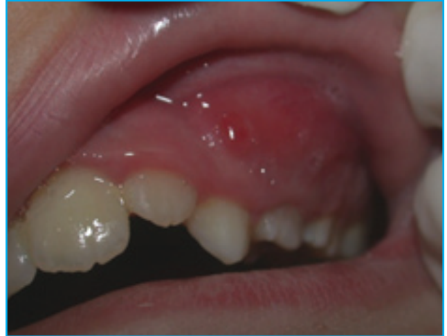
تعفن جهوي ناتج عن تسوس الأسنان