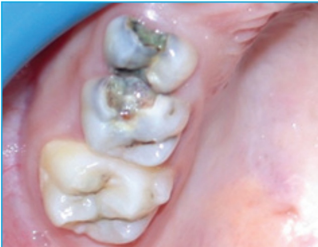
أضرار مصابة بالتسوس